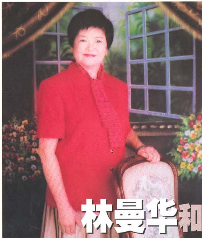
她将为中国领导人服务的经历视为终生的荣誉